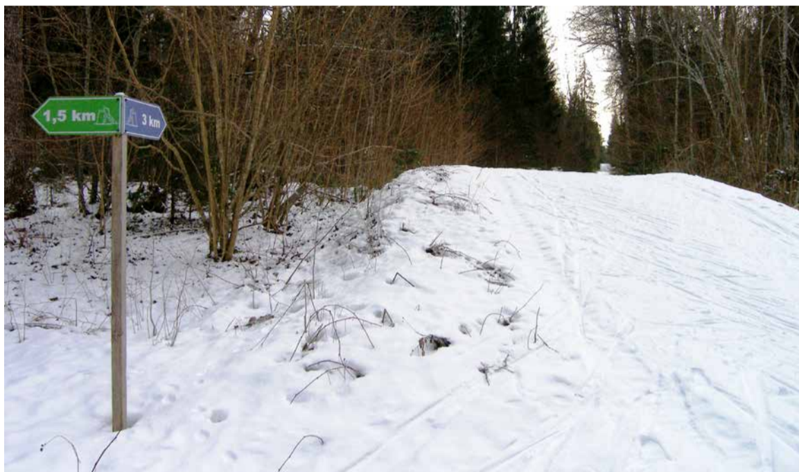
Alema terviserajal saab valida kahe tähistatud suusatiiru vahel. Valgustatud on 1,5-km ring.

Nissi valla servas Nurme külas, otsaga Raplamaal on metsa sees peidus mõnus maiuspala suusasõbrale, Alema suusarada.