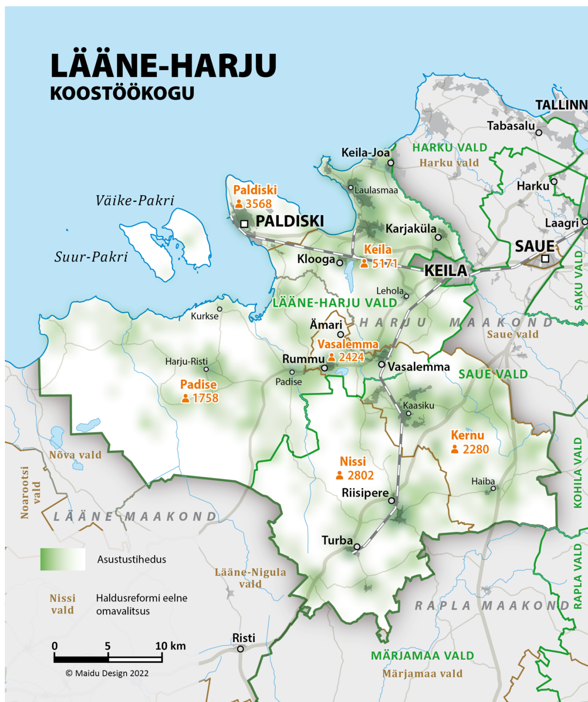
Joonis 1. Lääne-Harju Koostöökoogu tegevuspiirkond (2022. a andmed)

LHKK tegevuspiirkond asub Loode-Eestis Harjumaal, hõlmates kahe omavalitsuse territooriume (Joonis 1). Lääne-Harju vald kuulub tegevuspiirkonda tervikuna, Saue vald osaliselt (2017. a haldusreformieelsed Kernu ja Nissi vallad).